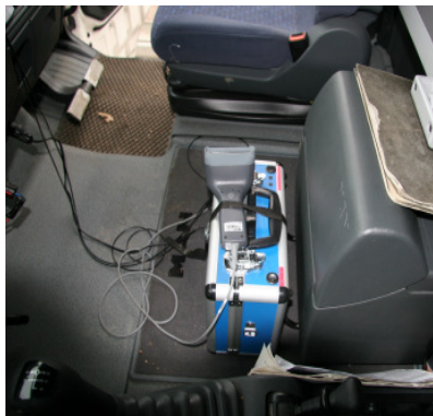
GPS/GSM-Koffer mit Handscanner