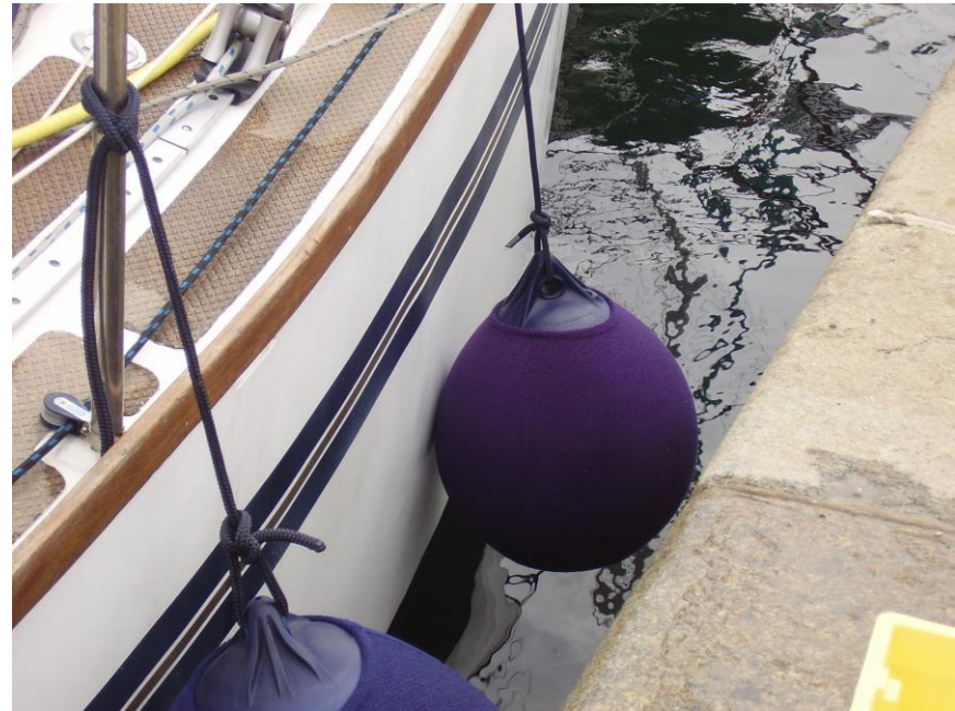
Fender an einem Segelschiff