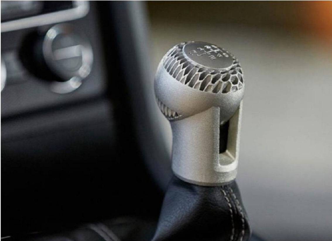
Schaltknauf PKW (Beispiel VW)