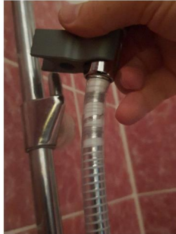
Adapter für Duschkopf