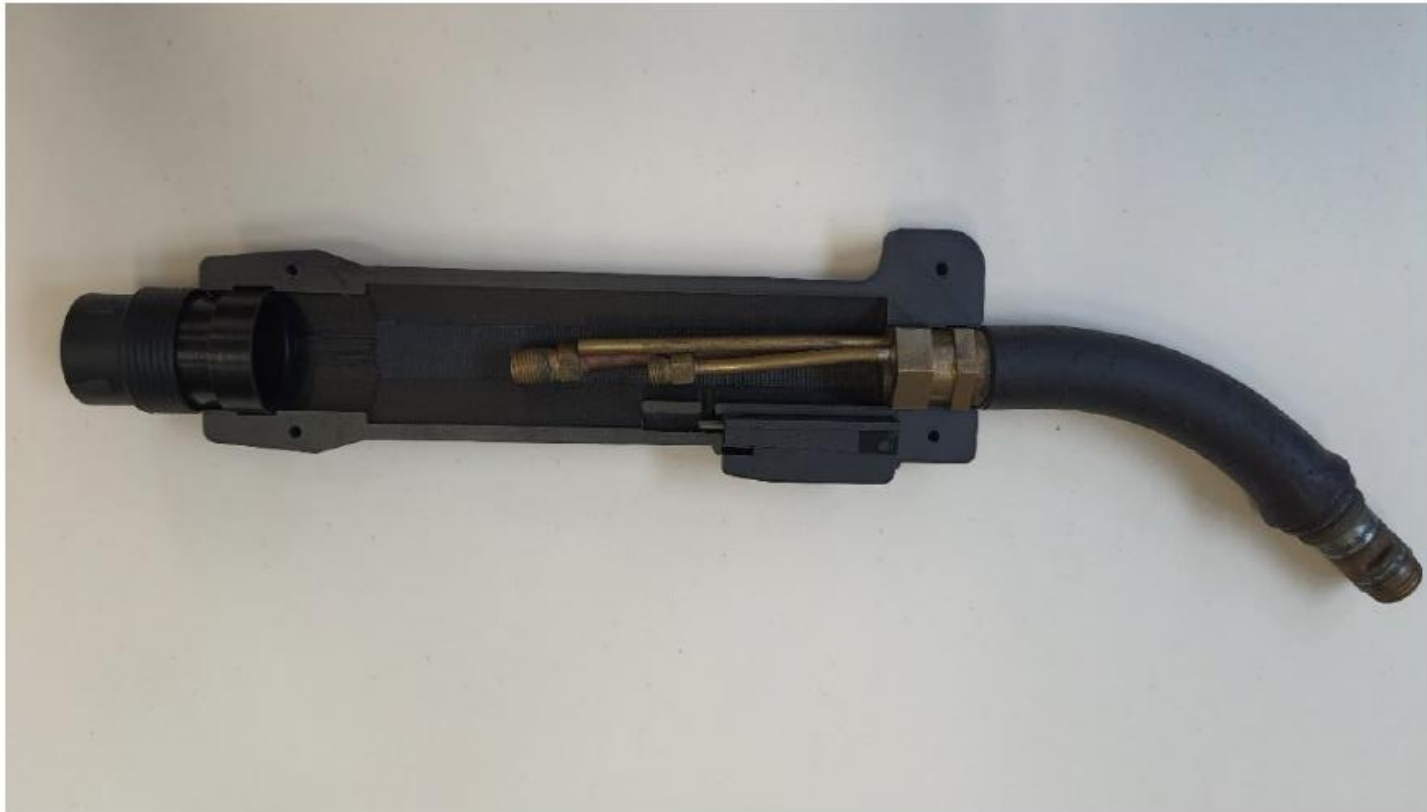
3D gedruckter Schweißgriff (Ersatzteil nicht mehr erhältlich)