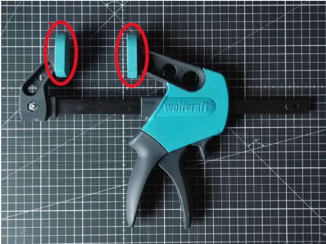
Schutzkappen an Holzzwingen