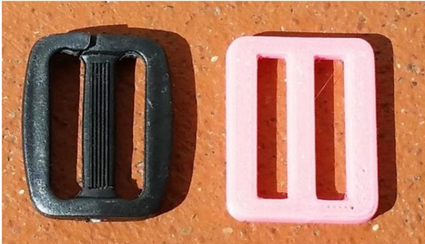
Ersatzschnalle für den Rucksack