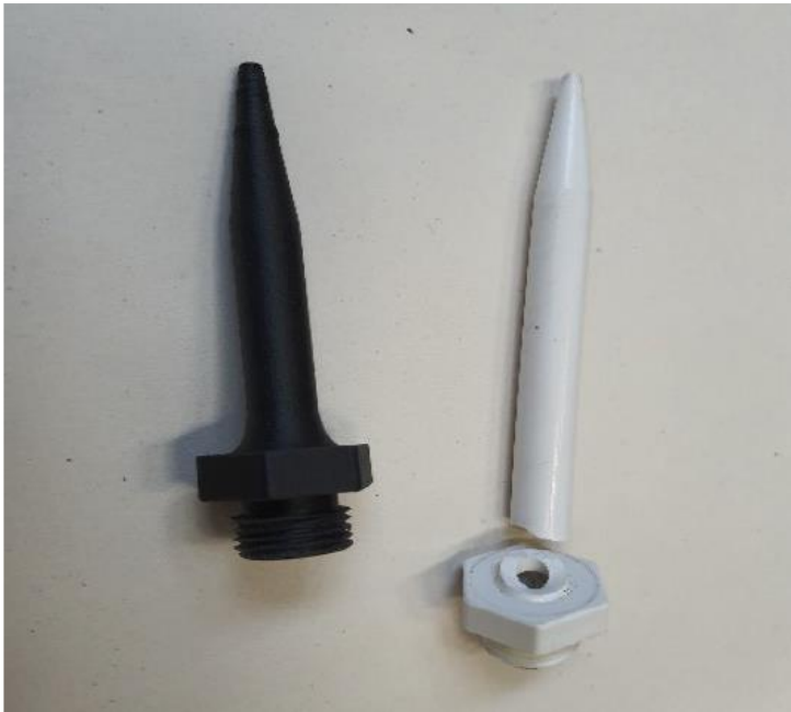
Reparierte und verbesserte Tülle zum Aufpumpen von Fendern