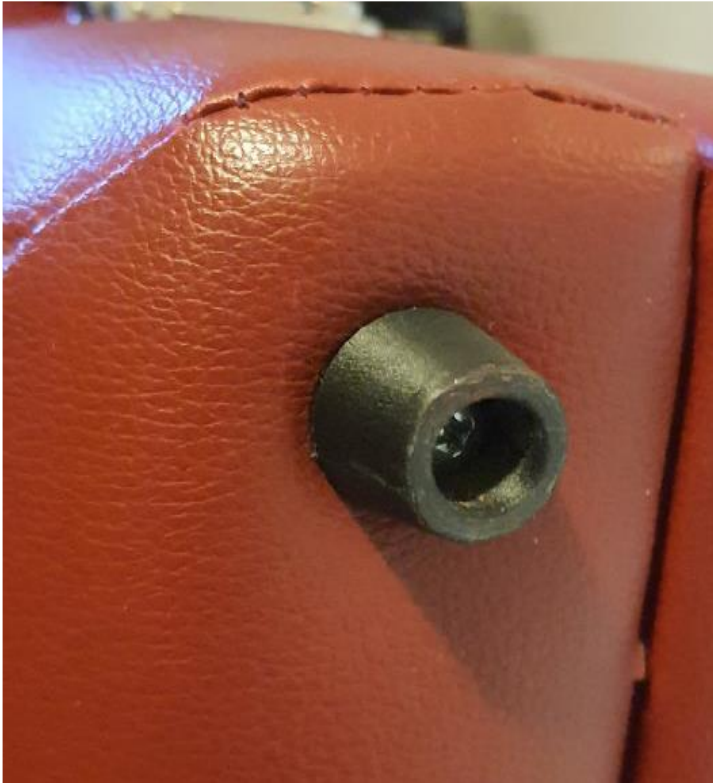
Fuß einer Massageliege